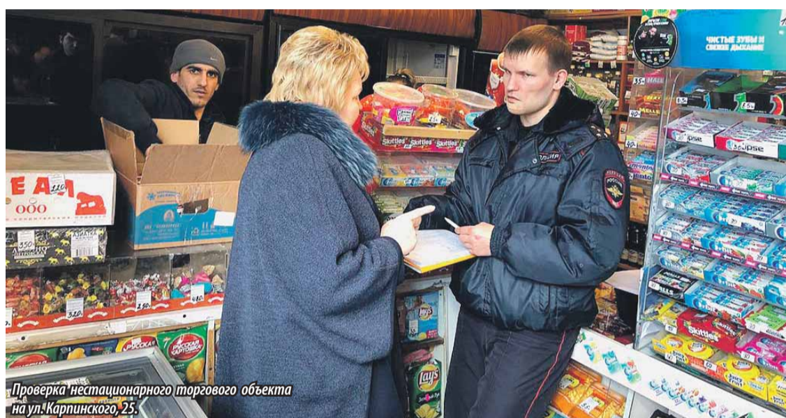
Проверка нестационарного торгового объекта на ул. Карпинского, 25.