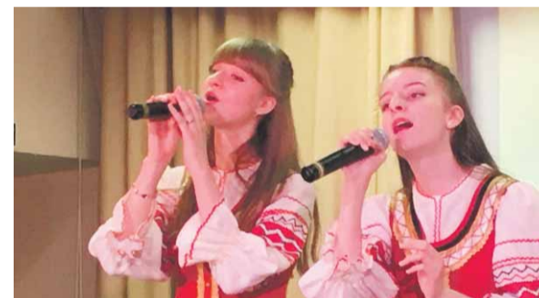
После концерта зрители получили сладкие сюрпризы от МО Пискаревка, организовавшего торжественное мероприятие.

С творческими номерами выступили воспитанники ДДТ из ансамбля народной песни «Калинушка», ансамбля народных инструментов «Сударушка», хореографического ансамбля «Юность» и студии «Кристалл». Ребята подарили всем присутствующим отличное праздничное настроение.