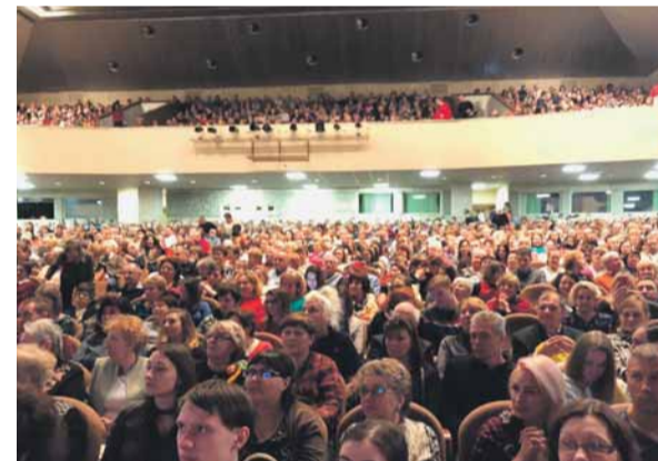
лей поздравили с женским праздником. Судя по настроению зала и аплодисментам в конце спектакля, подарок оценили.

Бесплатные билеты в муниципалитете выдали зарегистрированным на территории округа – так жители