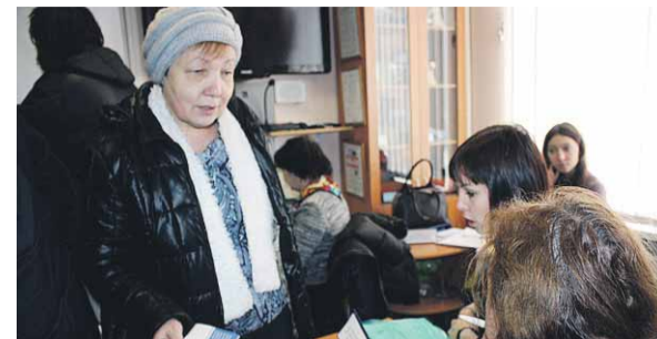
ранения, образования, сферы услуг, которые рассказали о своих вакансиях и ответили на вопросы.

Были организованы экспресс-подбор вакансий из общегородского банка данных и встреча с представителями работодателей района – производственными предприятиями, учреждениями торговли, здравоохранения, образования, сферы услуг, которые рассказали о своих вакансиях и ответили на вопросы.